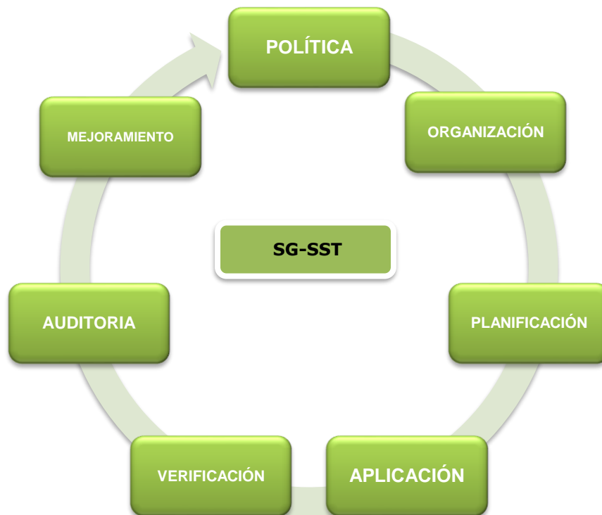
Diagrama 1: Esquema SG-SST

A continuación se muestra el esquema de sistema de gestión de la seguridad y salud en el trabajo Diagrama 1: Esquema SG-SST