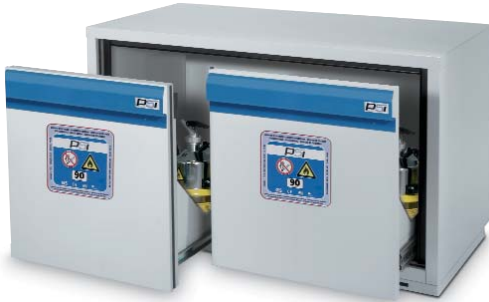
Serie F-2000 código 5028228.