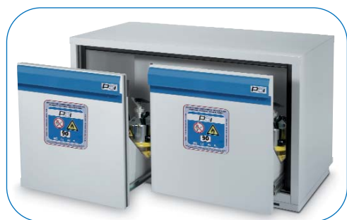
ARMARIOS DE SEGURIDAD RESISTENTES AL FUEGO