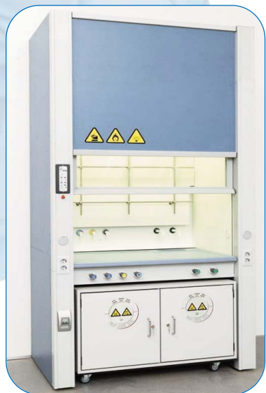
VITRINAS DE GASES