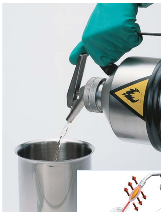
Dispensador de precisión con autocierre que facilita una dosificación exacta.

- Los modelos con dispensador, están dotados además de una válvula on/off de teléfono, que proporciona un control instantáneo en la dispensación.