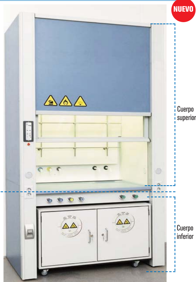
Bajo demanda se puede suministrar con medidas personalizadas.

Pasador de bloqueo de seguridad en puerta para la posición de trabajo recomendada.