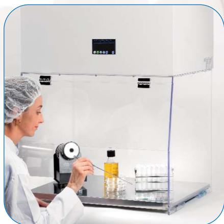
CABINAS DE FLUJO LAMINAR