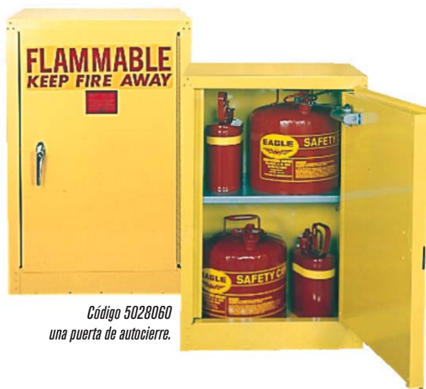
Código 5028060 una puerta de autocierre.