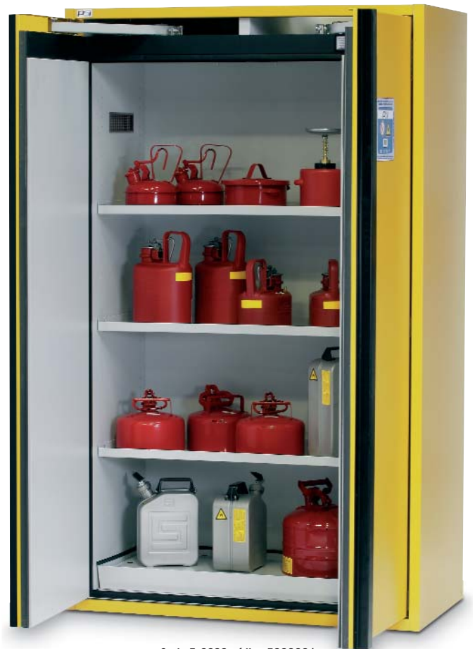
Serie F-2000 código 5028221.