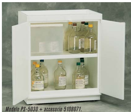
Modelo PS-5030 + accesorio 5108071.