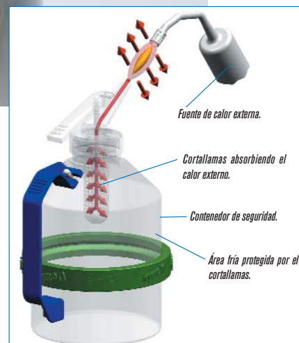
Fuente de calor externa.